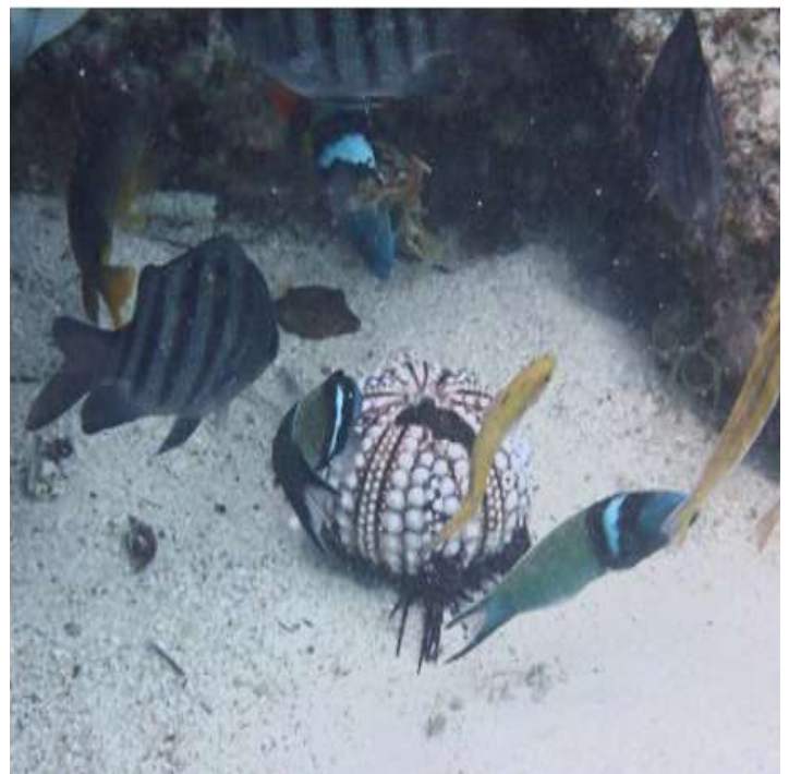
4. finalmente nan ta muri, y e restonan ta desintegra mas ainda door di pisca y otro animalnan marino